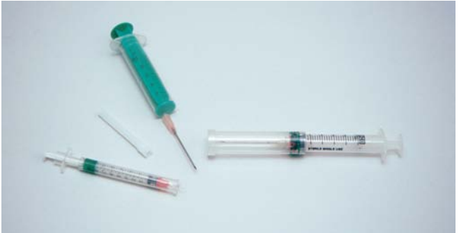
Rechts und links Sicherheitsspritzen