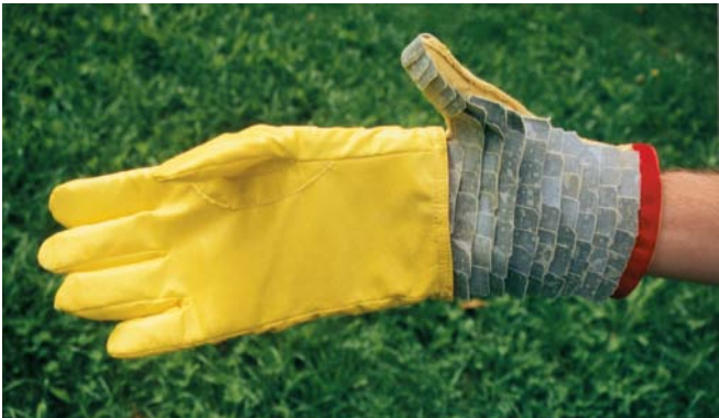
„Innenleben“ des Durchstich hemmenden Handschuhs